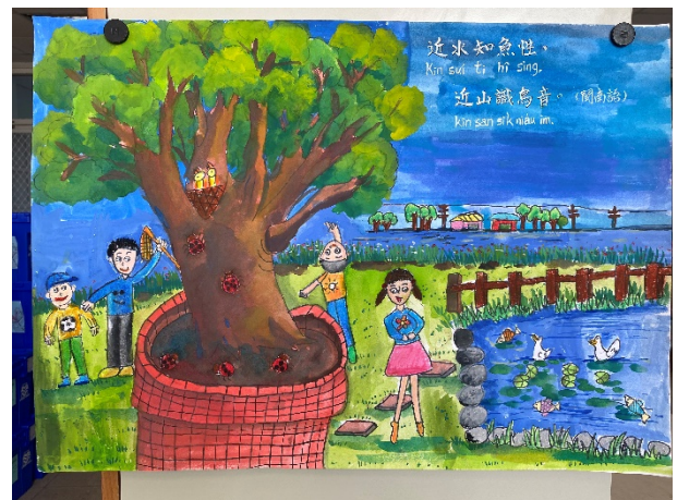
作品說明：結合本土語文俗諺創作「魔法語花一頁書」，融入本土語文與文化學習