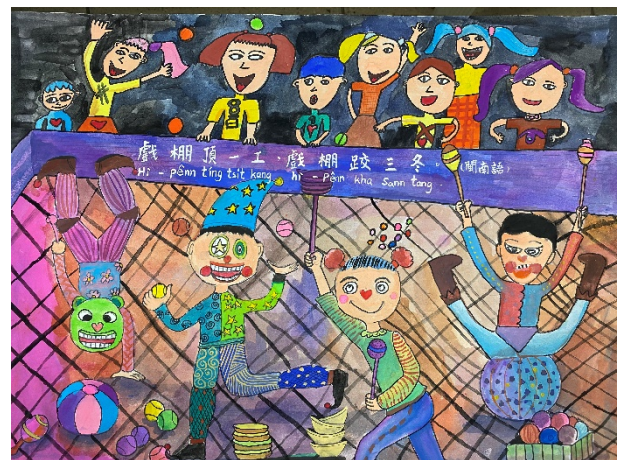
作品說明：結合本土語文俗諺創作「魔法語 花一頁書」，融入本土語文與文化學習