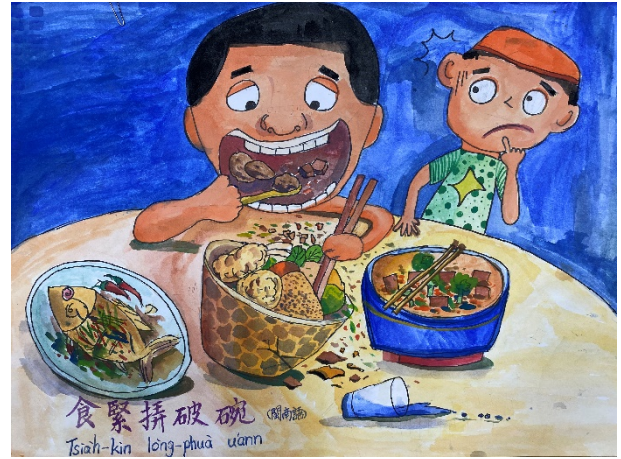
作品說明：結合本土語文俗諺創作「魔法語 花一頁書」，融入本土語文與文化學習