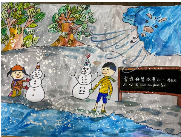
作品說明：結合本土語文俗諺創作「魔法語 花一頁書」，融入本土語文與文化學習