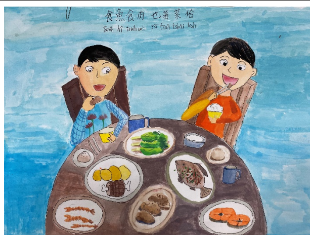
作品說明：結合本土語文俗諺創作「魔法語 花一頁書」，融入本土語文與文化學習