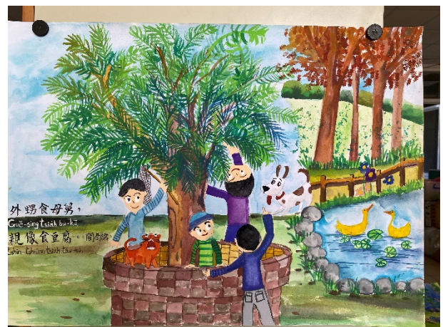
作品說明：結合本土語文俗諺創作「魔法語花一頁書」，融入本土語文與文化學習