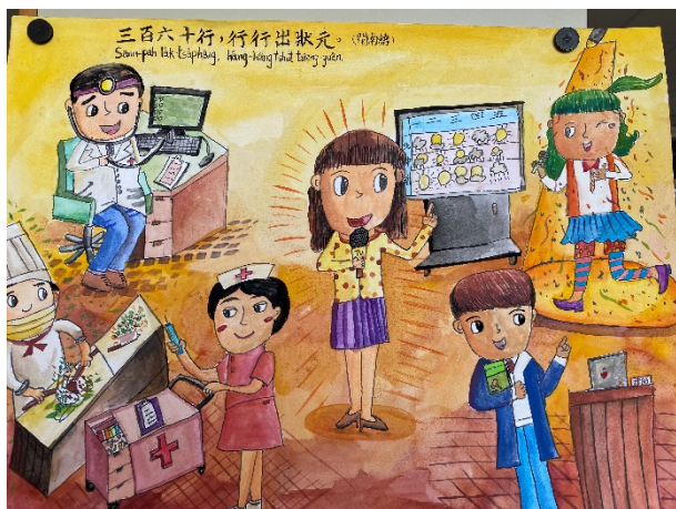
作品說明：結合本土語文俗諺創作「魔法語花一頁書」，融入本土語文與文化學習