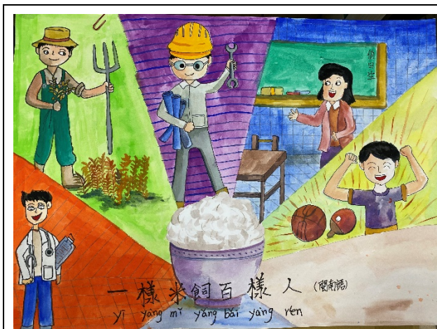
作品說明：結合本土語文俗諺創作「魔法語 花一頁書」，融入本土語文與文化學習