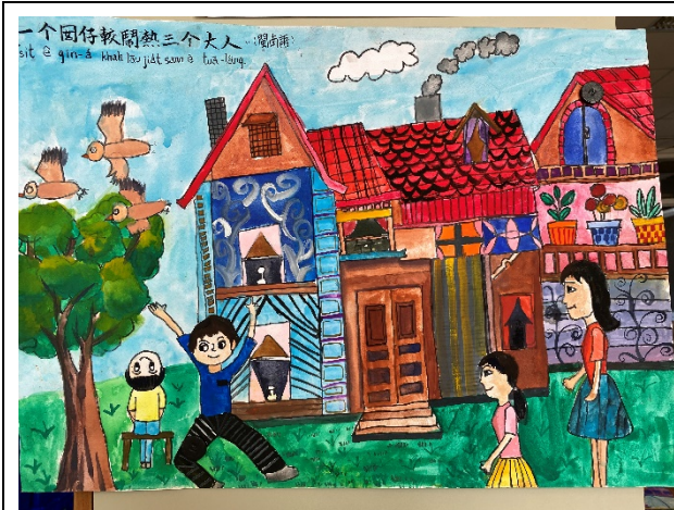
作品說明：結合本土語文俗諺創作「魔法語花一頁書」，融入本土語文與文化學習