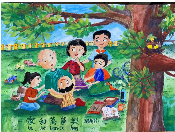
作品說明：結合本土語文俗諺創作「魔法語 花一頁書」，融入本土語文與文化學習