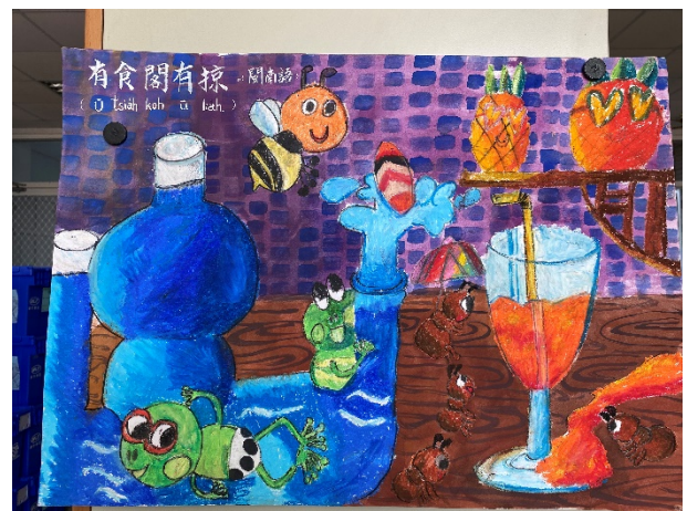
作品說明：結合本土語文俗諺創作「魔法語花一頁書」，融入本土語文與文化學習