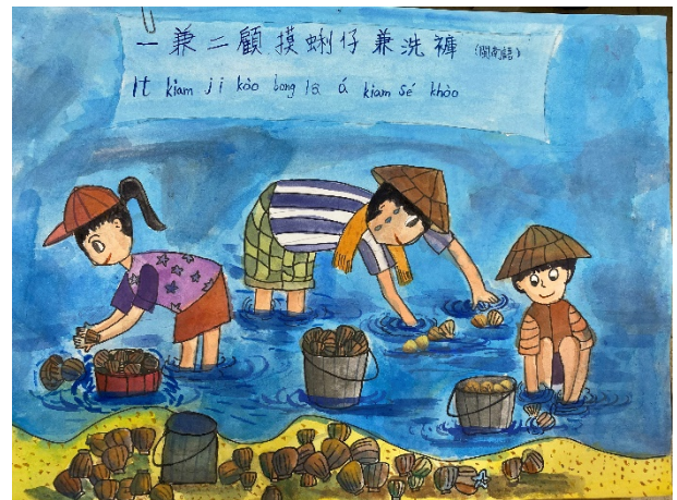
作品說明：結合本土語文俗諺創作「魔法語 花一頁書」，融入本土語文與文化學習