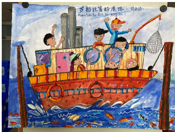
作品說明：結合本土語文俗諺創作「魔法語花一頁書」，融入本土語文與文化學習