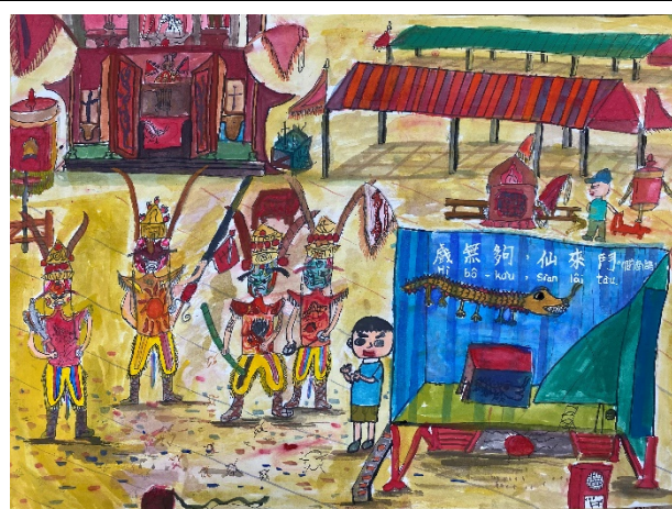
作品說明：結合本土語文俗諺創作「魔法語 花一頁書」，融入本土語文與文化學習